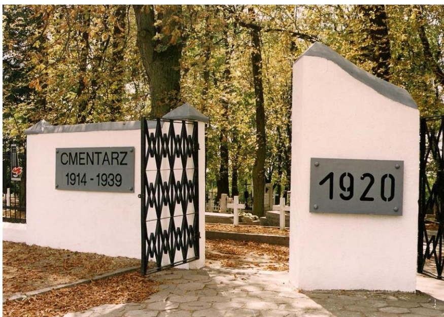
Fot. 1. Cmentarz garnizonowy w Płocku. Wygląd współczesny

Ponoć bezpośrednio po zakończeniu walk udało się zidentyfikować zaledwie 25 poległych. Później próbowano ustalić pełniejszą imienną listę poległych w walkach. Pierwszą taką próbą była lista opublikowana w Jednodniówce Dnia Legionowego w 1934 r., zawierająca 51 nazwisk 3 .