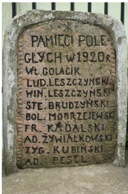
Fot. 5. Kamienna płyta na obelisku w Łubkach Nowych