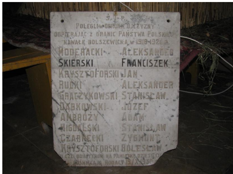
Fot. 12. Tablica ku czci poległym w wojnie polsko – bolszewickiej. Kościół w Sikorzu.