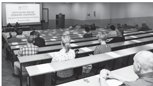
Członkowie TNP podczas obrad w Auli wykładowej SWPW

Współcześnie, kolejne sto lat później, również nie możemy z godnością i należnym szacunkiem dla naszych poprzedników obchodzić dwusetnej rocznicy Towarzystwa. Wirus COVID-19, który w 2020 roku przypomniał ludziom, że są tylko częścią ekosystemu, bardzo wpłynął na nasze zachowania i życie. Zamknięto nas w domach i wszelkie plany oraz zamiary legły w gruzach.