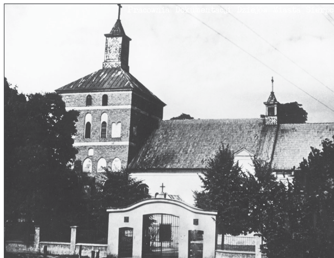
Kościół farny pw. Św. Wita, Modesta i Krescencji