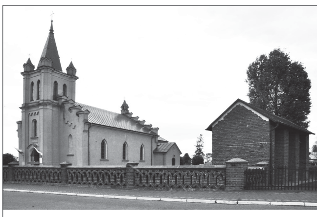
Słupia, kościół parafialny pw. św. Jakuba Apostoła, widok ogólny od południa, z prawej murowana dzwonnica, fot. Tomasz Kowalski, 2020 r.

stoi w bocznej kaplicy, przybudowanej od strony północno-zachodniej do prezbiterium kościoła parafialnego w Słupi, wzniesionego w 1875 roku. Obecny kościół zastąpił swojego drewnianego poprzednika. Warty szczególnej uwagi jest jednak fakt, że do onej drewnianej świątyni, przez kilka stuleci przybudowana była podobna, murowana i sklepiona kaplica, która od przynajmniej XVIII wieku mieściła interesujący nas krucyfiks i stała się miejscem jego szczególnej czci i rozwijania przez wiernych pasyjnej pobożności oraz ośrodkiem funkcjonowania Bractwa Ukrzyżowanego Pana Jezusa 2 . Tok wywodu w niniejszym tekście, oparty