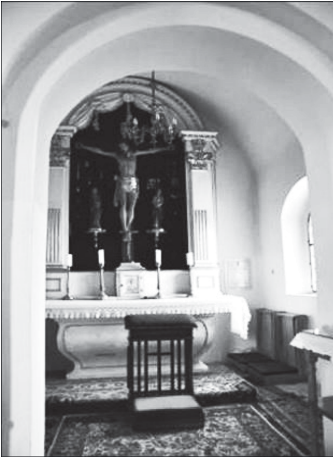
Słupia, kościół parafialny, widok ogólny wnętrza kaplicy bocznej, fot. Tomasz Kowalski, 2020 r.

w dużej mierze na analizie archiwalnych przekazów, będzie prowadzony dwutorowo – przyjrzymy się dziejom kaplicy oraz dziejom krucyfiksów – które w pewnym momencie ostatecznie się sprzęgły. Spróbuję odpowiedzieć na pytanie kto zainicjował kult krucyfiksów w kościele w Słupiu, jakie były jego przejawy i jak potoczyły się jego dalsze losy.