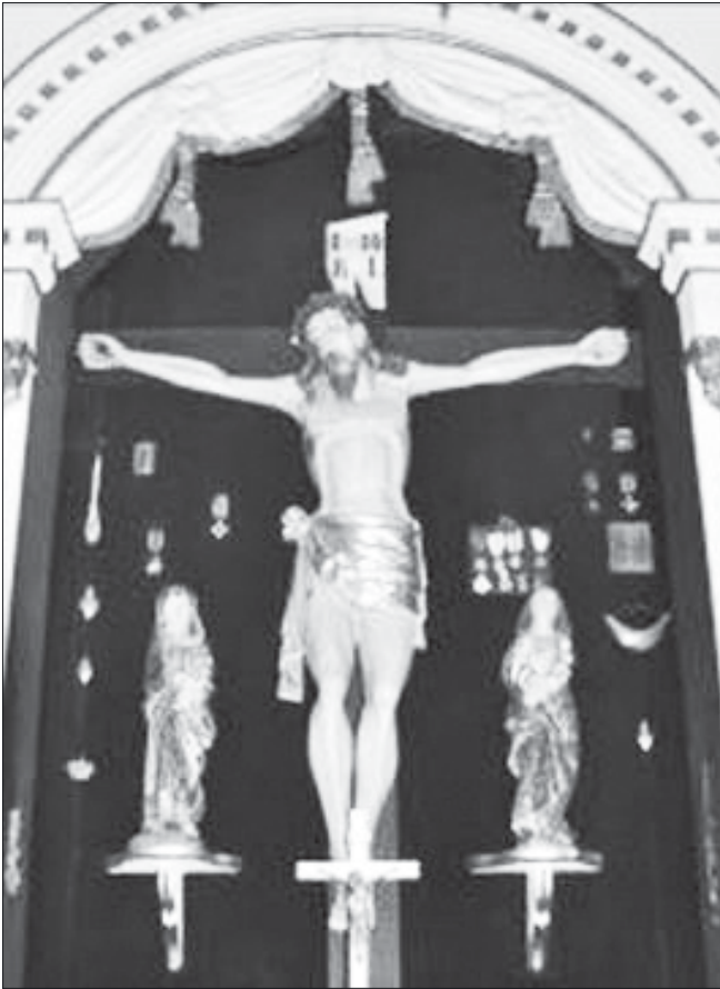
Słupia, kościół parafialny, kaplica boczna, krucyfiks z XVII w.

z prawej strony opadają falistym puklem na obojczyk, z lewej, podebrane za uchem, opadają na bark. Duże, przymknięte oczy o migdałowym wykroju, długi, prosty nos, usta nieznacznie rozchylone uwidaczniające uzębienie okolone dwoma mięsistymi pasmami wąsów 13 .