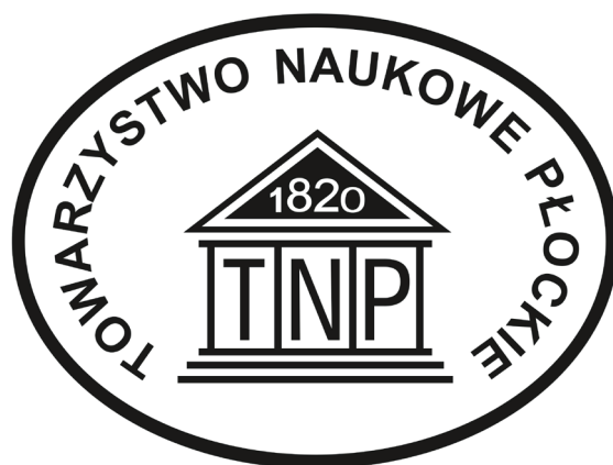
Znaczek Towarzystwa Naukowego Płockiego z 2020 r.

Ważnym momentem Zwyczajnego Walnego Zebrania było podjęcie Uchwały nr 1 w sprawie