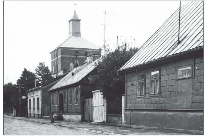
Ulica Marcelego Nowotki. Z prawej wieża kościoła farnego pw. Św. Wita, Modesta i Krescencji

z parafii Lutocin, Poniatowo i Żuromin listów tych wiernym nie odczytali oraz nic nie mówili o „osiągnięciach” Polski Ludowej 42 .