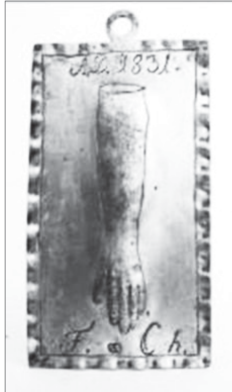
Słupia, kościół parafialny, kaplica boczna, srebrna tabliczka wotywna z 1831 r., fot. Wacław Górski (z archiwum Fototeki IZiK UMK w Toruniu)

pochodzący z poprzedniego kościoła, sprawiając dla niego nową nastawę ołtarzową. Dostosowane wielkością do jej wnętrza retabulum zyskało formę półkolistej arkady, dekorowanej od frontu parą kanelowanych, korynckich pilastrów, która ujmowała wnękę z umieszczonym w niej centralnie krucyfiksem, po którego bokach umieszczono figury asysty – Matki Bożej i św. Jana Ewangelisty (prawie trzykrotnie mniejsze od figury Chrystusa, różne od niej stylowo). Podłucze arkady ozdobione zostało rzeźbioną, podwieszaną trzema suptami draperią, ze złotym lamowaniem i sznurami z chwostami. Całość nastawy ujęta została parą uszaków z umieszczonymi na nich centralnie dwiema figurami świętych biskupów. Tło wnęki ołtarzowej (z czasem wybite ciemnym sukнем) stało się miejscem ekspozycji wotów dziękczynnych. Fakt zaprojektowania w nowym kościele osobnego miejsca do ekspozycji tej ważnej, zabytkowej rzeźby (bezsprzecznie stanowiącym aluzję do dawnej kaplicy przy nieistniejącej już świątyni) dowodzi świadomego nawiązania do historii tego miejsca oraz poszanowania i podtrzymywania trwającej od dziesięcioleci tradycji kultu tej figury. Krucyfiks ujęty w nową nastawę, której forma jasno podkreślała jego niepoślednią rolę w pobożności, a „teatralna” aranżacja (rzeźbiona tkanina, niczym odstonięta znad wizerunku zastłona; arkada jako echo triumfalnego łuku i otoczenie wizerunku