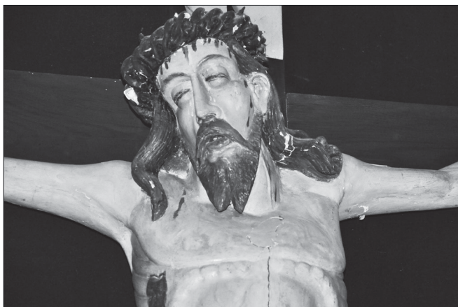
Słupia, kościół parafialny, kaplica boczna, krucyfiks z XVII w., detal – głowa Chrystusa, fot. Tomasz Kowalski, 2020 r.

przypominał wiernym i ją w pewien sposób unaczniat 18 .