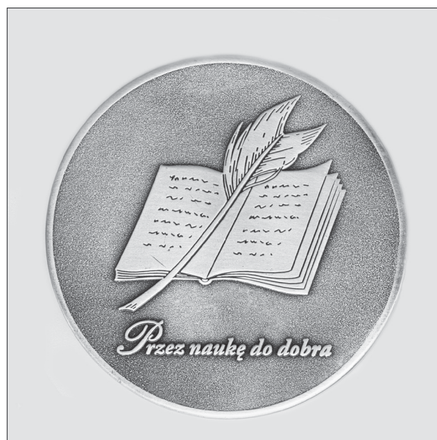
Medal wybity z okazji 200-lecia Towarzystwa Naukowego Płockiego, awers i rewers. Projekt: Stanisław Płuciennik, wykonanie: Firma Barossa