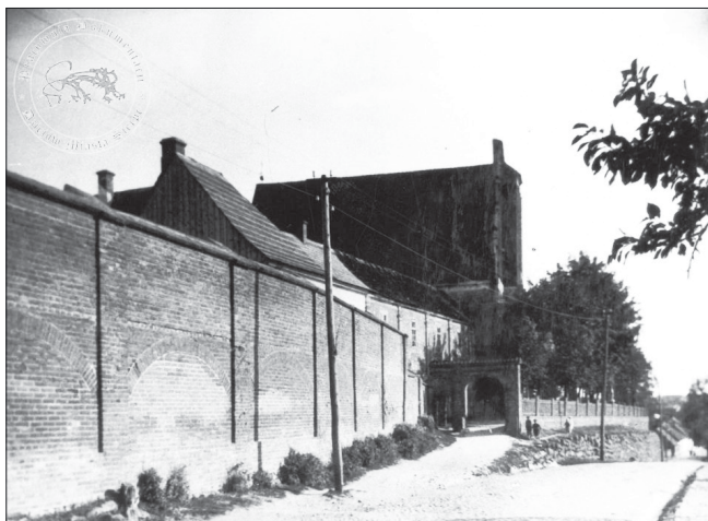
Wjazd do kościoła pw. Wniebowzięcia NMP w Sierpcu, przy którym znajdował się klasztor ss. Benedyktynek