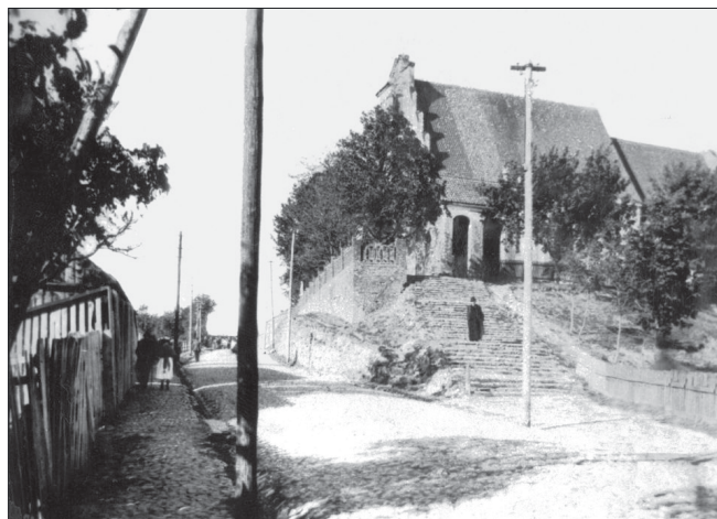
Kościół pw. Wniebowzięcia NMP w Sierpcu

9 lutego 1953 r. Rada Państwa PRL wydała „Dekret o obsadzaniu duchownych stanowisk