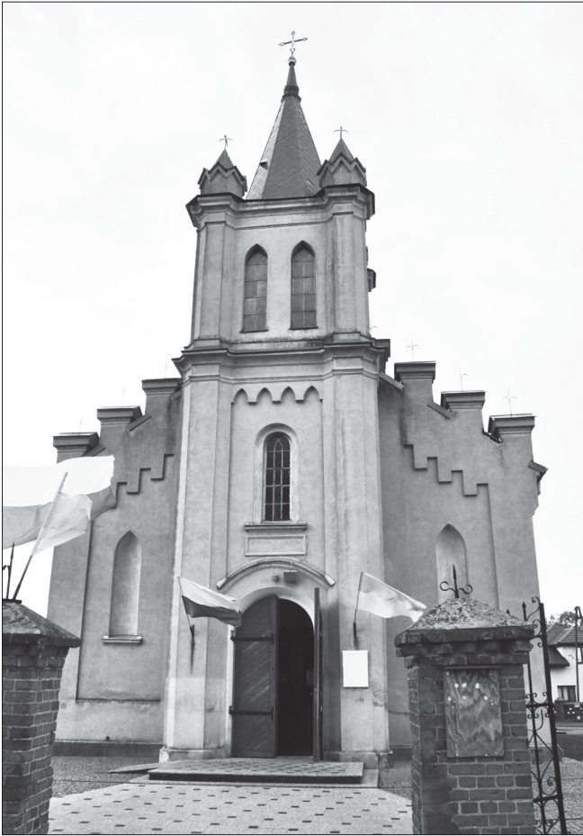
Słupia, kościół parafialny pw. św. Jakuba Apostoła, widok ogólny fasady, fot. Tomasz Kowalski, 2020 r.

30 kopiejek, które były przeznaczone „na światło”, a na każdym z kwartalnych nabożeństw członkowie wpłacali składkę w wysokości 3 kopiejek 23 .