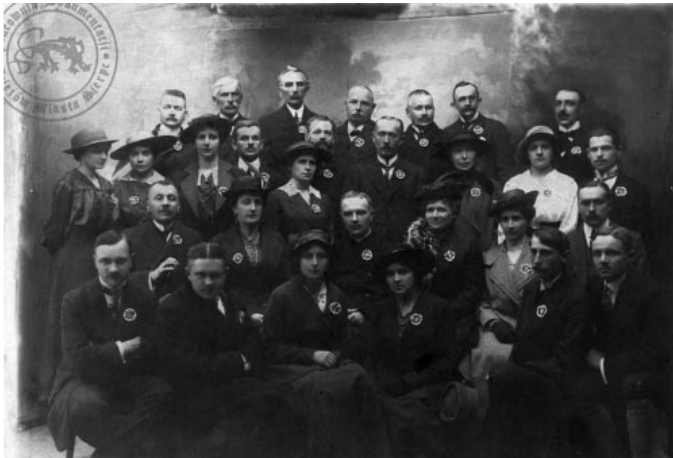
Założyciele Sierpeckiego Oddziału Towarzystwa Naukowego Płockiego

One of the driving forces for the development of Sierpc was the process of localism. Localism in the period between 1918 and 1939 was understood as a social movement, concentrating on preserving or restoring the cultural heritage of a given region and promoting its administrative and economic growth. In the interwar period, Sierpc used its development potential only to a certain degree. Further economic growth was made impossible because of the backwardness of the region and economic depression. A second obstacle to the city's growth was the social unrest in the local community. It prevented important decisions from being made - ones that could allow faster economic and social development of the town.