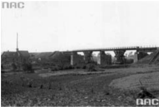
Most na Skrwie w Sierpcu. Widok ogólny mostu. Widoczne drewniane podpory przęsła mostu. Data wydarzenia: rok 1935. Sygnatura: 1-G-3395.

Wiosną 1919 roku władze krajowe podjęły decyzję w formie Ustawy o budowie linii kolejowej Zgierz–Kutno–Płock–Sierpc. Uroczyste otwarcie tej linii nastąpiło 18 listopada 1934 roku. Na trasie kolejowej Płock–Sierpc o długości 36 km, wybudowano dwie stacje kolejowe w Proboszczewicach i Gozdowie. 13 kwietnia uchwalono rozporządzenie Prezesa Rady Ministrów w sprawie budowy linii kolejowej na trasach Sierpc–Brodnica i Sierpc–Toruń. 23 stycznia 1937 roku nastąpiło uroczyste otwarcie linii kolejowej Sierpc–Toruń, a w grudniu 1938 roku Sierpc–Brodnica. Inwestycje te spowodowały naturalne utworzenie w Sierpcu ważnego węzła kolejowego. Polskie Koleje Państwowe stały się znaczącym pracodawcą 35 .