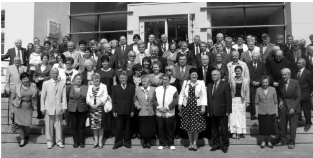
Uczestnicy konferencji

Ważniejsza jednak, jak sądzę, dla tożsamości współczesnego i przyszłych pokoleń jest imponująca dalsza historia naszego miasta i wzbudzające głęboki szacunek dokonania, bohaterstwo i patriotyzm żyjących tu w minionych wiekach naszych poprzedników.