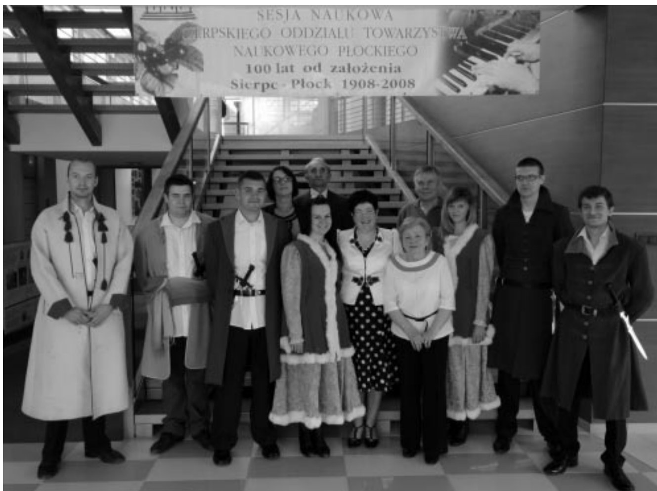
Stażyci Urzędu Skarbowego wraz z organizatorami witali gości przed wejściem na salę konferencyjną

Za najbardziej właściwą i jednocześnie najbardziej przydatną dla lokalnej społeczności formę udziału TNP w jubileuszu, uznaliśmy zorganizowanie konferencji naukowej pt. 690 lat miasta Sierpca – historia i współczesność . Obyła się