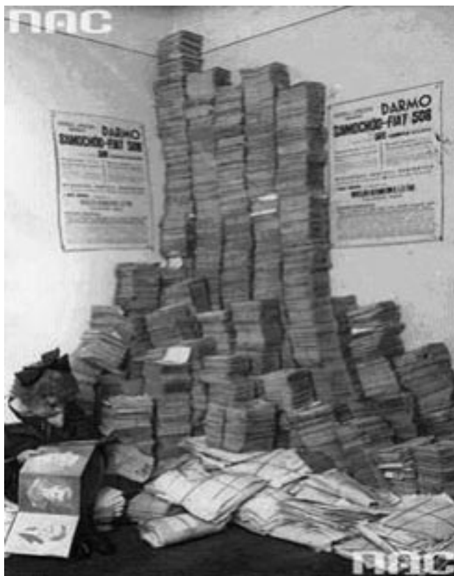
Letni konkurs Polskiego Radia. Kupony nadstane na konkurs. Data wydarzenia: 1937. Rozgłośnia w Warszawie. Sygnatura: 1-K-1388.

Wystawa Radiowa w Sierpcu miała do spełnienia ważne cele. Prezentacja odbiorników radiowych różnego typu i co z tym związane różnej ceny miała zachęcić zwiedzających do zakupu odbiornika radiowego i wstąpienia w