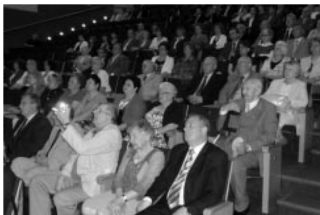
Uczestnicy konferencji

Regionalne inicjatywy gospodarcze podejmowane były indywidualnie i nie korespondowały z Programem Regionalizmu Polskiego, choć w niektórych przypadkach były z nim zbieżne. Głównym celem tych przedsięwzięć było poprawienie sytuacji gospodarczej społeczności lokalnej. Sierpeccy działacze gospodarczy zwracali uwagę na konieczność opracowania planu gospodarczego dla miasta i regionu. Zwracali szczególną uwagę na zagadnienia poprawy infrastruktury drogowej, budowy kolei szerokotorowej. Opracowania planu zagospodarowania przestrzennego miasta. Wypracowania systemu mechanizmów zachęt dla tworzących miejsca pracy np. w postaci tańszej energii czy ulg podatkowych. Zwracano w tym czasie uwagę na kryzys, który szczególnie dotknął rzemiosło. Pro-