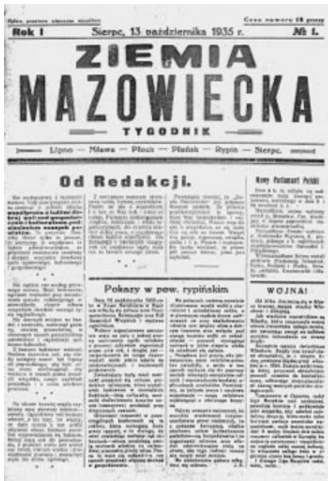
Pierwszy numer tygodnika Ziemia Mazowiecka z 13 października 1935 r.

W latach 1935–1939 ukazywał się w Sierpcu tygodnik Ziemia Mazowiecka . Była to gazeta,