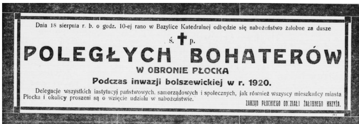
Fot. 3. Zawiadomienie o nabożeństwie żałobnym 18 sierpnia 1924 r. („Dziennik Płocki” 1924, nr 188 z 16 sierpnia, s.1)

Okrojona forma uroczystości – bez pochodu na groby poległych – musiała spotkać się z negatywnymi komentarzami mieszkańców, bowiem w roku następnym powrócono do wariantu obchodu z 1922 r., czyli mszy i pochodu do Bratniej Mogiły. Organizatorami obchodu były Zarządy oddziałów Polskich Towarzystw Żałobnego i Czerwonego Krzyża.