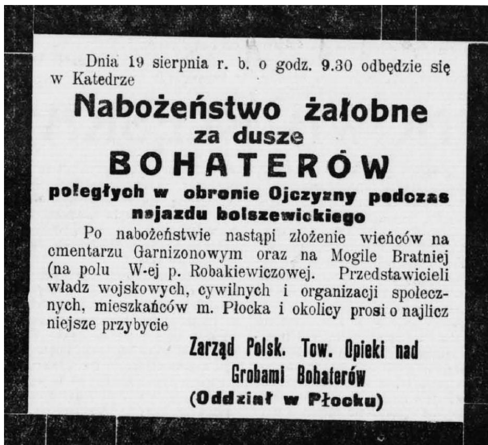
Fot. 6. Zawiadomienie o nabożeństwie w intencji poległych w 1920 r. („Dziennik Płocki” 1932, nr 180, s.1)