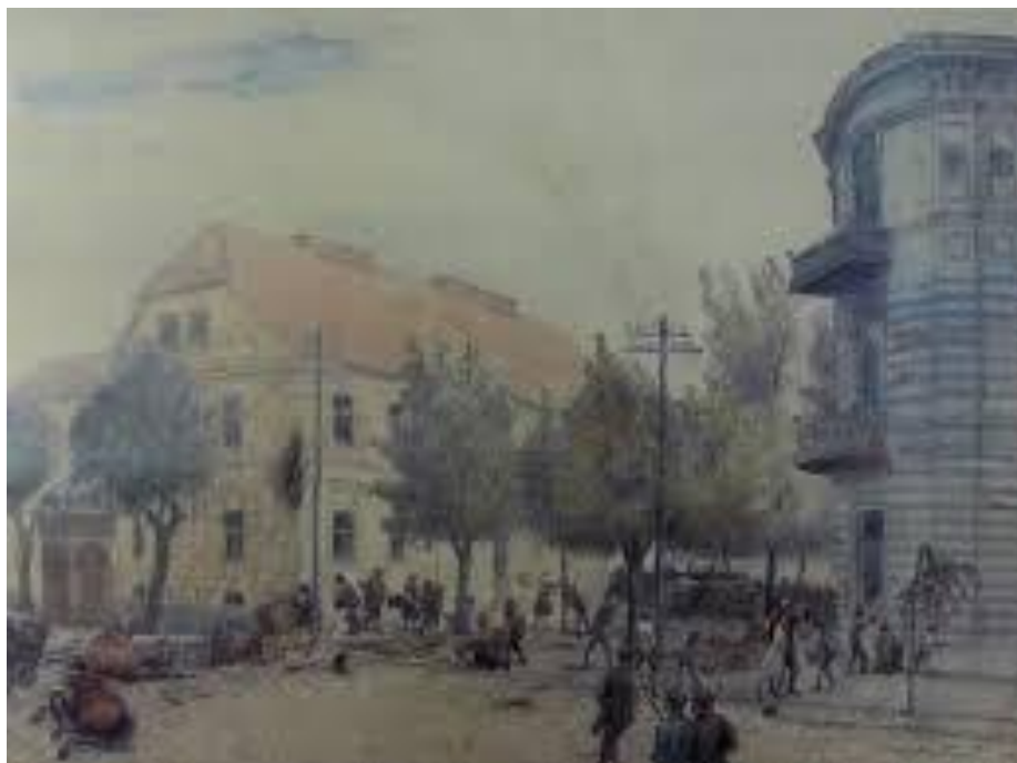
Fot. 1. Obraz A.Poraj – Różyckiego „Barykada przy poczcie w 1920 roku” (Muzeum Mazowieckie w Płocku)

„Pod cieniem drzew, pomiędzy tchnącym przeszłością gmachem poczty a kamienicą z nowszych czasów, w jasny, pogodny dzień wre walka. Walczą nasi żołnierze, uwijają się z bronią w ręku cywile, kobiety, dziewczęta, chłopcy, nawet dzieci biorą żywy udział. Liście i gałązki zaścielają ulice, a druty telefonów zwieszają się w bezładnej płataninie. Szyby potłuczone, w murze wyłom, zabite konie. [...] Barwy jego subtelne, miłe dla oka, lekkie, nadają powiewność [...]. Uczucie pogody ducha i optymizmu, uwielbienie dla piękna promieniają od tego dzieła. Pod niebem pogodnym i krwawe walki mniej się wydają straszne, tym bardziej, że nadzieja zwycięstwa odczuwa się w ruchu osób działających i unosi jak mgła nad całą kompozycją” – tak o obrazie pisał dziennikarz „Kuriera Płockiego” 12 .