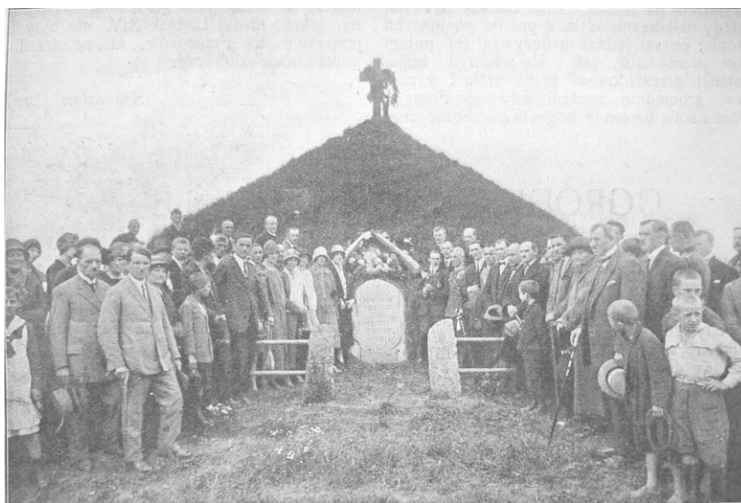
Fot. 5. Bratnia Mogiła w 1925 r. („Żołnierz Polski”, 1925, nr 40 )

Mogiły i uporządkowanie grobów było zasługą jednej osoby – „p. W., która swą ciągłą błaganą uzyskała i po prostu wyzebrała to, co zrobiono”. Zapewne chodziło o Helenę Wagnerowi, znaną w Płocku działaczkę społeczną.