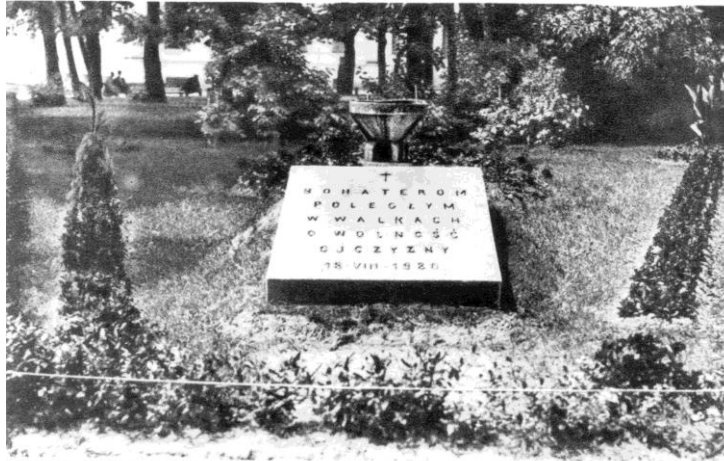
Fot.4. Płyta Poległych na pierwotnym miejscu w 1925 r.

Wobec faktu złożenia płyty oddział Polskiego Towarzystwa Żałobnego Krzyża zmodyfikował program obchodu, dodając poświęcenie płyty oraz złożenie na niej wieńców i kwiatów. Po południu 19 sierpnia 1925 r. – na skutek odezwy PTŻK – na czas pochodu pozamykano sklepy na trasie przemarszu, a płoccy fabrykanci zwolnili wcześniej pracowników bez potrącania zarobków, aby umożliwić im udział w uroczystościach.