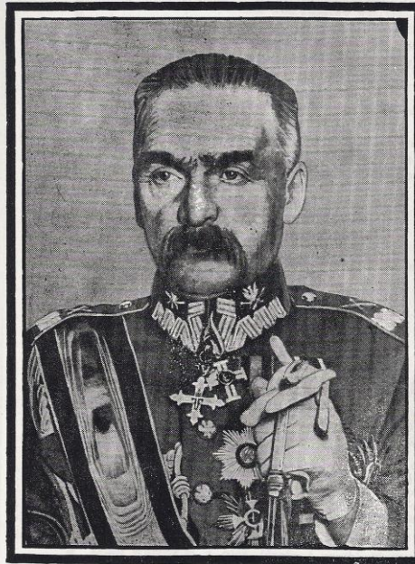
Pierwszy Marszałek Polski Józef Piłsudski