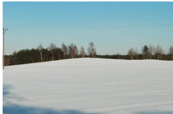
Fot. 3 - 4. Wzniesienia Wysoczyzny Płońskiej na zachód od Łubek zimą 2012 r.

Natomiast w rezultacie niskich temperatur, utrzymujących się w 1932 r. przez długi czas być może „powstała warstwa zmarzliny, sięgająca kilka, czy kilkanaście metrów w głąb, powodując rozsadanie polodowcowych skał i głazów, zalegających na takiej głębokości lub zamarzanie wody w warstwach wodonośnych” 12 .