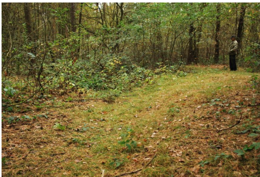
Fot. 1. Z lewej strony widoczne wgłębienie po rowie, powstałym na skutek pęknięć gruntu

Według niego wiosną 1932 r. okoliczni mieszkańcy zasypywali łopatami powstałe ze szczelin rowy, a mimo to, jeszcze po 10 – 15 latach były one wyraźnie widoczne, sięgając bawiącym się tam dzieciom do pasa. Informację o zasypywaniu pod Staroźrebami rowów ziemią zapamiętała także z przekazów rodzinnych p. dyr. Biblioteki im. Zielińskich TNP Grażyna Szumlicka – Rychlik. Świadczyłoby to, że wiosną – po rozmarznięciu gruntu – szczeliny przybrały rozmiary głębokich rowów, zagrażających bezpieczeństwu ludzi i zwierząt.