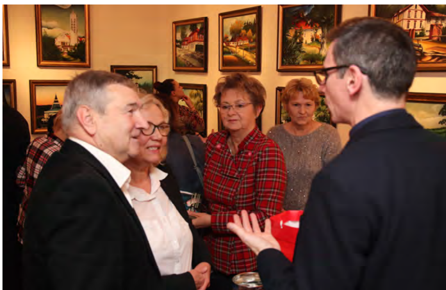
3 grudnia 2019 r. Spotkanie pt. Publikacje Towarzystwa Przyjaciół Ziemi Sierpeckiej w latach 1999–2019 i ich autorzy