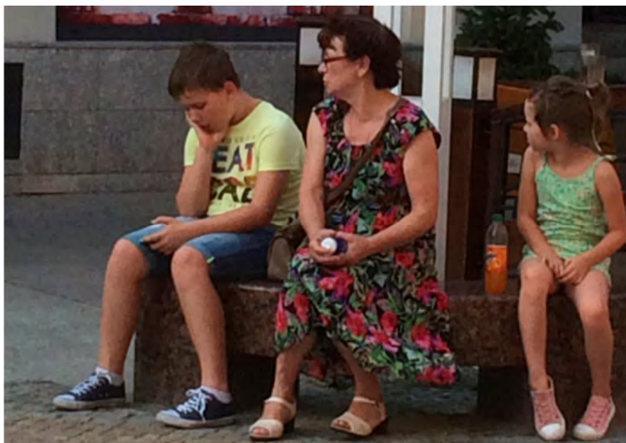
Zdjęcie 5. Trudna komunikacja na ławce