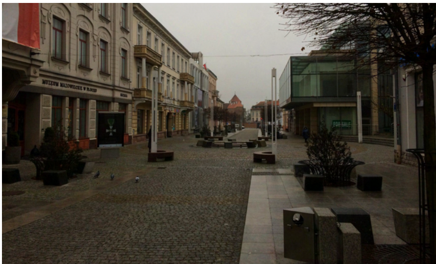
Zdjęcie 1. Pusta ulica Tumska

Podstawową obserwacją potwierdzającą słowa badanych – zarówno mieszkańców Płocka, jak i przedsiębiorców – jest raczej niewielka liczba osób przebywających na ulicy Tumskiej. Zdarzają się w ciągu dnia momenty, kiedy ulica ta wygląda niemal na wymarłą, pustą.