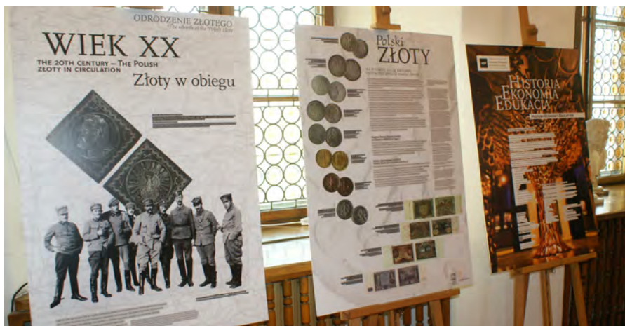
Fragment wystawy Dzieje złotego zorganizowanej przez TNP wspólnie z NBP – Oddział Okręgowy w Warszawie i PTN – Oddział w Płocku