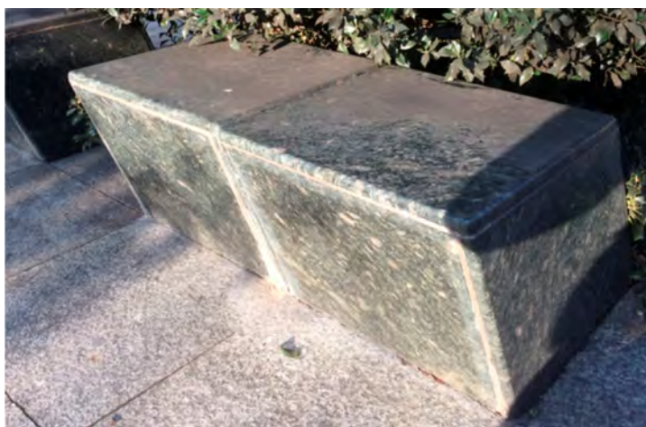
Zdjęcie 7. Zaniedbane i zarośnięte przez ostrokrzew siedziska „klocki”