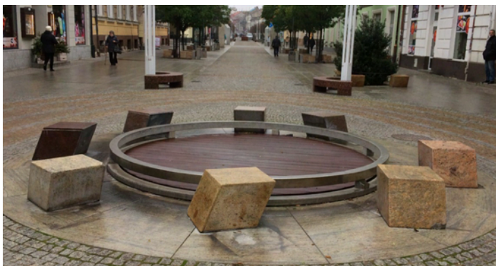
Zdjęcie 6. Niefunkcjonalne „klocki” wokół fontanny

Ulica Tumska wyglądała na umiarkowanie czystą – brak było dużych śmieci i wyraźnych zanieczyszczeń. Natomiast elementy małej architektury (klocki, latarnie) są nieco zanieczyszczone i sprawiają wrażenie zaniedbanych, przez co zniechęcają do korzystania i zamiast zdobić – szpecą.