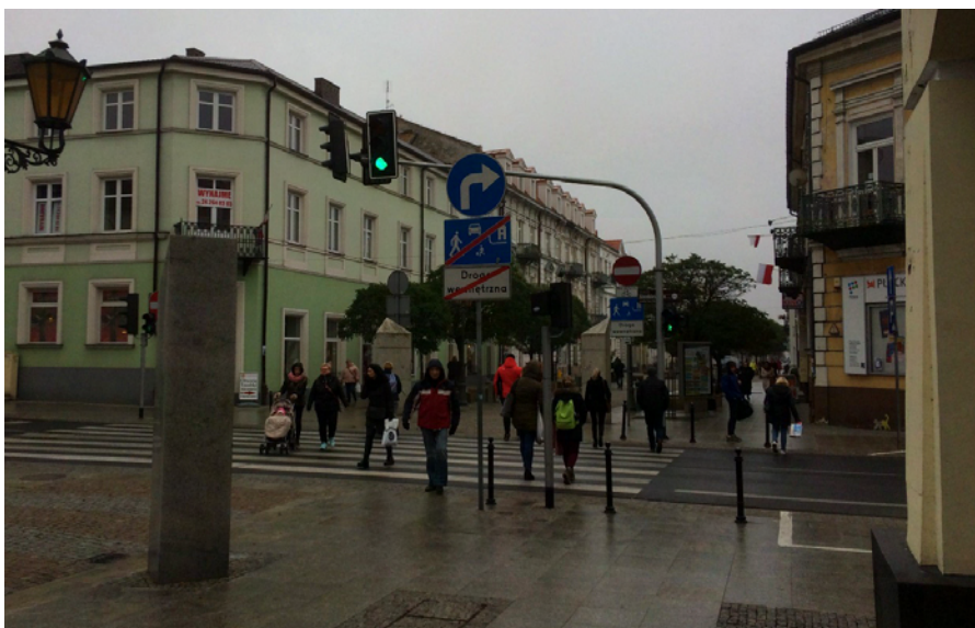
Zdjęcie 2. Większe nasilenie ruchu na ul. Tumskiej przed południem

W czasie dnia zmienia się także charakter ruchu ulicznego. W dni powszednie większe nasilenie ruchu obserwuje się przed południem i po południu. Zdecydowanie mniejsze natomiast wieczorem.