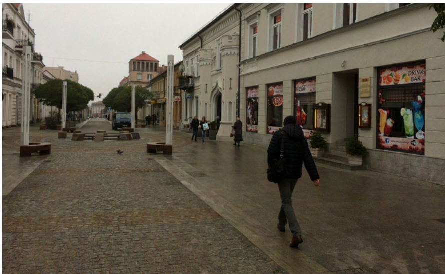
Zdjęcie 4. Przechodnie poruszający się bokami ulicy Tumskiej