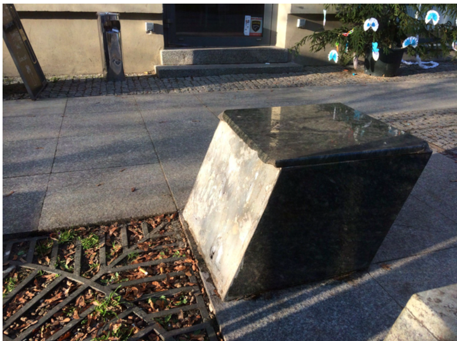
Zdjęcie 8. Zniszczone siedzisko „klocek”