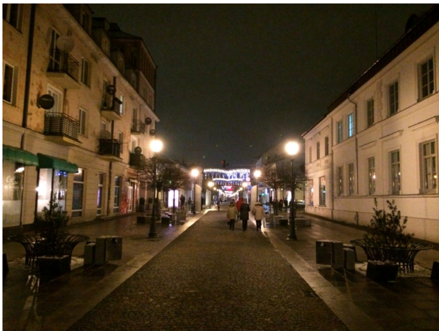
Zdjęcie 3. Ruch na Tumskiej w weekend wieczorem

W weekend ruch „ciąży” ku Tumom i ulicy Grodzkiej. W ciągu tygodnia ruch wydaje się być równomierniej rozłożony w kierunku Grodzkiej i Królewieckiej oraz Kwiatka/Kolegialnej i Sienkiewicza.